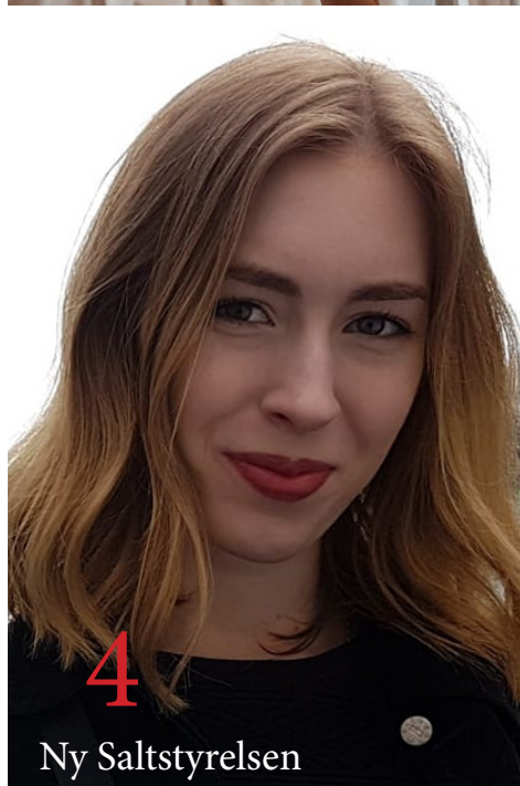
4 Ny Saltstyrelsen