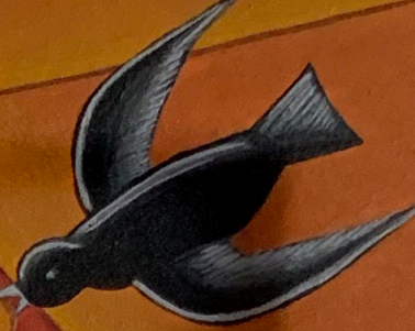
ABB A ANTONIUS