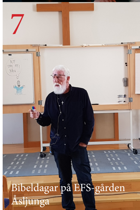
Bibeldagar på EFS-gården Åsljunga