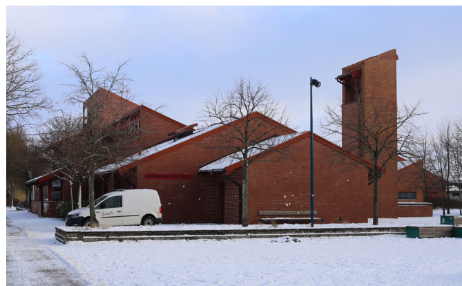
Lerbergets kyrka har ett strategiskt läge mitt i byn.

I sammanhangen som representeras här tycks det inte som något problem att locka barn och unga till samlingarna; snarare lyfts behovet av tydliga gränser för dem som vill delta. I Örkelljunga till exempel har man framgångsrikt infört ett system med två inlägg,