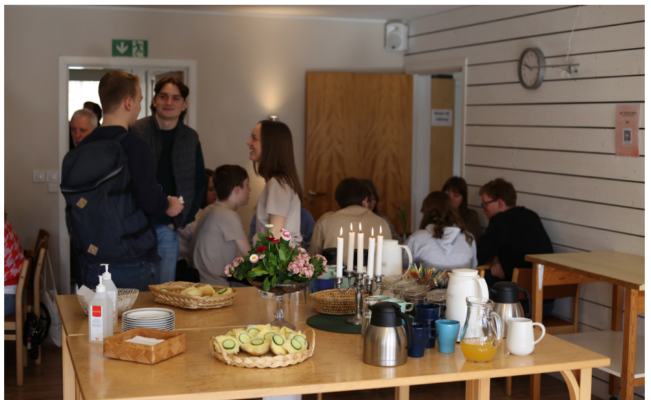
Dagen inleddes med fika.