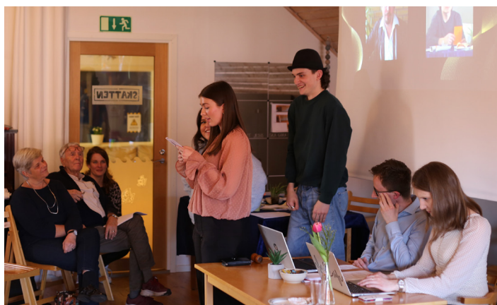
Salts årsmöte präglades av kreativitet och spex

Salts årsmöte präglades av kreativitet och spex. Detta motiverades i handlingarna med att: "Salt Sydsverige önskar att årsmötet görs på ett begripligt sätt för barn och ungdomar så att de kommer hem mer redo och inspirerande att engagera sig i Salts arbete". Verksamhetsberättelsen blev således en gissningstävling och planen för 24/25 illustrerades med drama. Kvällen avslutades med ett konstituerande möte för den nya styrelsen, men inte minst med pizza!