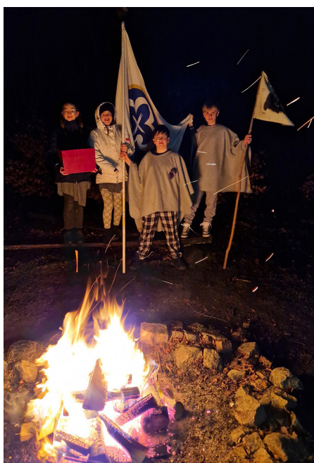
Flaggan är erövrad!

Vi vet att vi skapar möten och sår frön med läger. Min egen väg började med patrullriks i Sällershög 1975 då jag tog alla pengar jag ägde och köpte en bibel i lägerkiosken. Det blev tillfälligt mindre godis, men en ny framtid. Jag tackar alla inblandade för årets Wintercampen och hoppas vi ses igen nästa år!