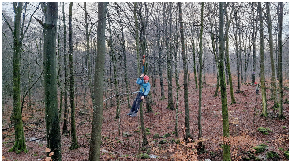
Linbanan, sextio meter lång.

höghöjdsaktivitet och vi som var med har ytterligare ett gemensamt minne för år som skall komma. Vi var där! Och såg det med egna ögon!