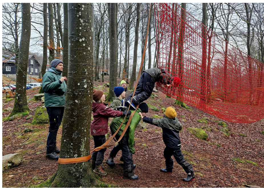
Scouterna fångas i jättenätet.