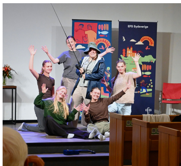
Dansgruppen GLOW från Ängelholm framförde två danser under förmiddagen.